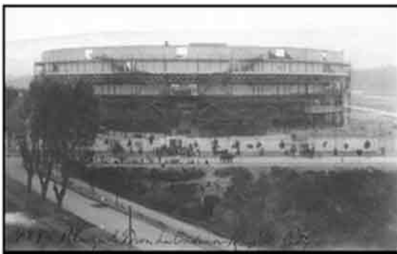
Antigua Plaza de Toros “La Condesa” del Torero en México D. F.